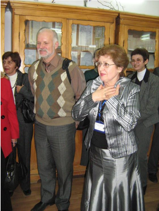
Відкриття читально-експозиційного залу імені академіка Д. І. Багалія при науково-дослідному відділі документознавства, колекцій рідкісних видань і рукописів ХДНБ. м. Харків, жовтень 2011 р.